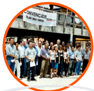
1ª Convenção em 1999 Reuniu as principais lideranças da empresa.

Em 2015 a MCM ficou entre as 15 primeiras empresas de engenharia industrial do Brasil no ranking da Revista O Empreiteiro, e foi eleita pela mesma como a 1ª do norte/nordeste.