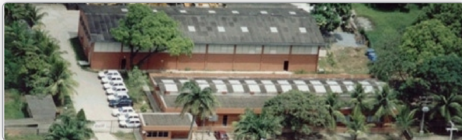
Escritório Central MCM - Ano 1999

iniciou sua carreira de destaque como especialista na montagem de fábricas de cimento. Já no 1º ano de trabalho, executou a montagem eletromecânica da Unilever Igarassu, bem como a atuação em melhorias e pequenas ampliações na planta industrial da antiga Brahma no município do Cabo de Sto. Agostinho, hoje AMBEV. As Unilevers se destacam no curso do tempo, pois são obras que entraram no escopo de projetos da MCM desde a sua fundação e permanecem como clientes até os dias de hoje. Depois disso a empresa só cresceu. Em seis meses já possuía 100 funcionários e grandes projetos. Os escopo de obras e a responsabilidade só aumentaram, assim também como a confiança dos clientes que passaram a ter a MCM não apenas como fornecedora de mão de obra especializada, mas como parceira.