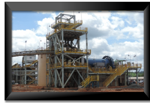
Avanco ~ Curionópolis - PA