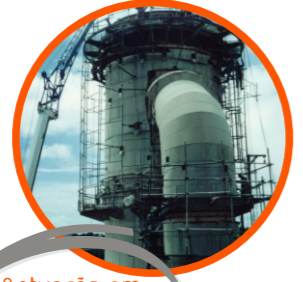
1ª atuação em fábrica de cimento CIMEPAR - PB - 1997