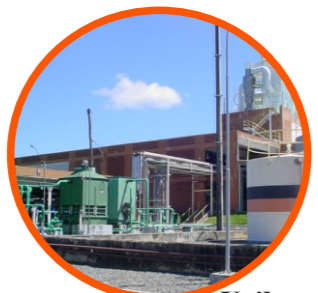
Unilever Cliente há 20 anos.