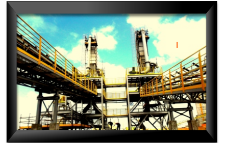
Apodi ~ Quixeré - CE