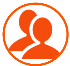
30 funcionários Efetivo da primeira obra