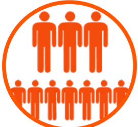
Maior efetivo em 20 anos 4.500 colaboradores - 2013/2014.