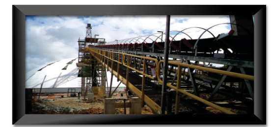
CCP ~ Pintimbu - PB