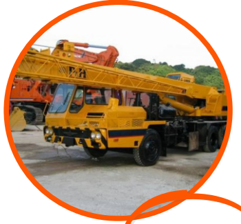
1º Equipamento P&H

É a abreviação das principais frentes de serviço da empresa