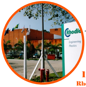
1ª Obra Rhodia - 1997