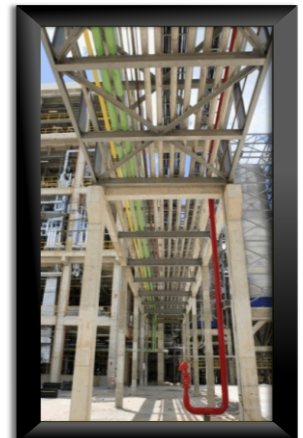
M&G ~ Cabo - PE