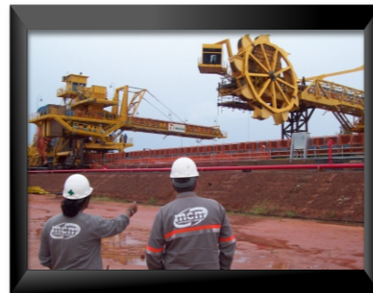
Alcoa world ~ Juruti - PA