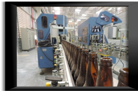
IVN ~ Estância - SE