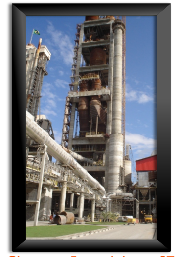
Cimesa ~ Laranjeiras - SE