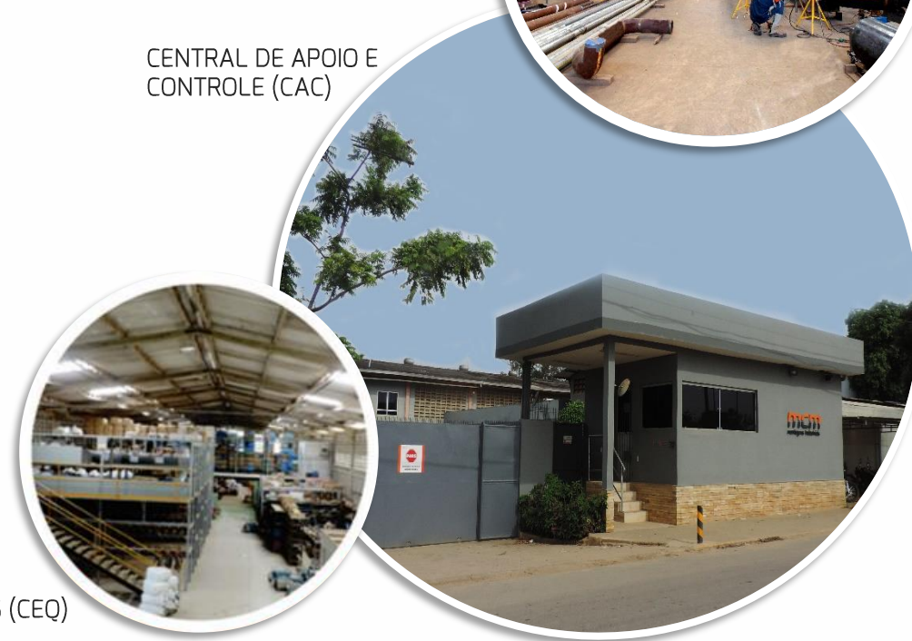
CENTRAL DE APOIO E CONTROLE (CAC)