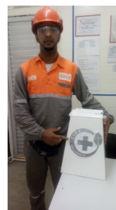
Boas práticas: Urna da CIPA