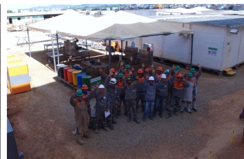
GENTE QUE FAZ ACONTECER!

TUDO QUE UM SONHO PRECISA PARA SER REALIZADO, É DE PESSOAS QUE TRABALHEM POR ELE.