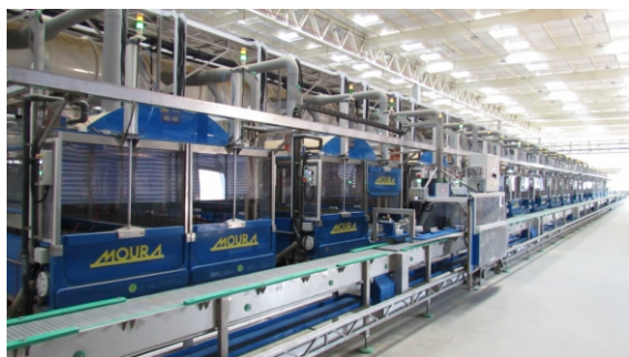
A PRIMEIRA LINHA DE MONTAGEM DA UNIDADE 10 ESTÁ FUNCIONANDO DESDE OUTUBRO DE 2017

Gostaríamos de parabenizar toda equipe que esteve à frente deste grande projeto.