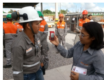
Blitz do Bafômetro

Parabenizamos pela iniciativa de todos os envolvidos nestas ações!