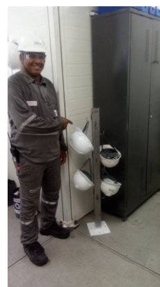
Boas práticas: Organização de capacetes