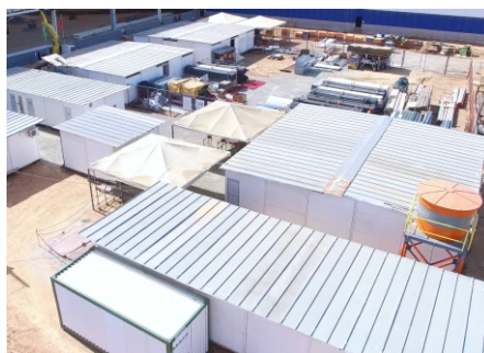
O MAIOR CANTEIRO DA NOSSA HISTÓRIA