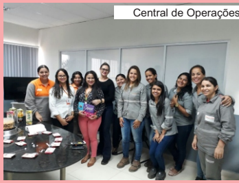
Central de Operações