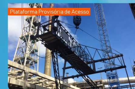
Plataforma Provisória de Acesso