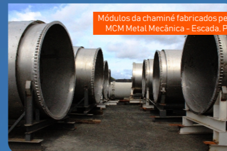
Módulos da chaminé fabricados pela MCM Metal Mecânica - Escada, PE.

O apoio do Departamento de Inovação e Tecnologia para desenvolver uma plataforma de acesso que facilitou no corte para a desmontagem da chaminé antiga evitando o uso de andaimes e minimizando tempo e principalmente riscos de acidentes na operação. Iniciamos a desmontagem da antiga chaminé em 06 de junho com o prazo previsto para finalizar no início do mês de julho.