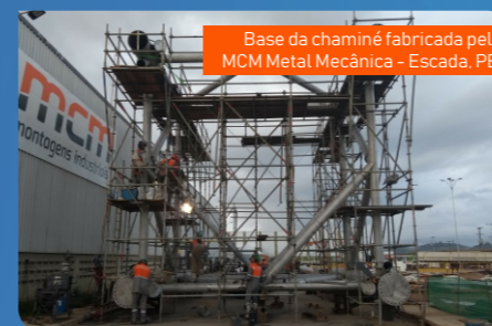
Base da chaminé fabricada pela MCM Metal Mecânica - Escada, PE.