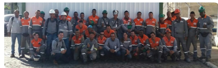
Ultracargo | Ipojuca - PE