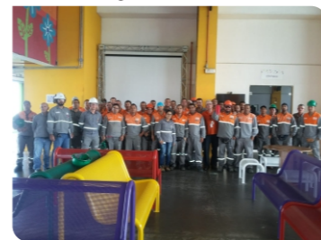
Obra Mondelez Vitória de St. Antão - PE