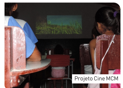
Projeto Cine MCM

O Projeto Cine MCM consiste em levar conhecimento acerca de assuntos relacionados a Meio Ambiente e o Convívio Social em instituições e escolas carentes. No dia da ação, além de muito aprendizado, atividades e dinâmicas, houve também distribuição de lanche, para tornar esta experiência ainda mais prazerosa. Cerca de 44 crianças de 5 a 13 anos assistiram ao filme Vida de Inseto e puderam aprender mais sobre trabalho em equipe e conscientização ambiental. Colaboradores da CEQ, QSMS, MKT e RH se voluntariaram para monitorar a ação.