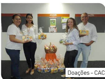
Doações - CAC

A solidariedade é um ato de bondade com o próximo, onde quem ganha mais é quem doa.