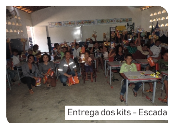
Entrega dos kits - Escada