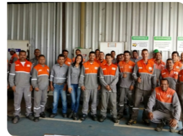
Obra Lever Igarassu - PE