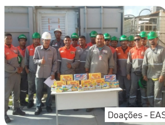
Doações - EAS