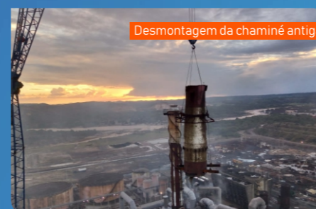
Desmontagem da chaminé antiga

Na desmontagem da torre T-1106 e relocação da nova Casa Remota trabalhamos na área ácida, bastante agressiva, mas conseguimos executar as atividades com qualidade e sem nenhum acidente.