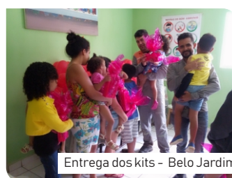
Entrega dos kits - Belo Jardim