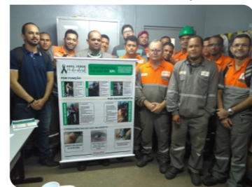
Obra M&G Cabo de St. Agostinho - PE