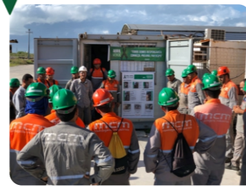
Obra EAS Ipojuca - PE