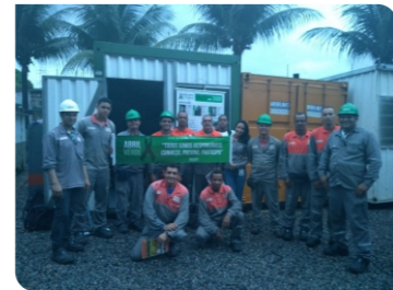
Obra Kibon Jaboatão dos Guararapes - PE